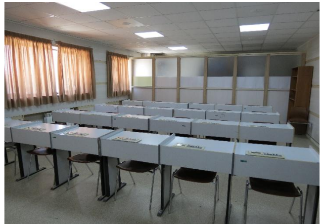
لابراتوار شماره ۲