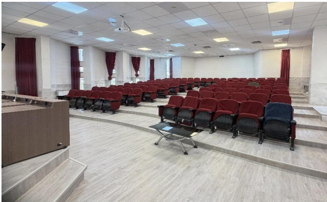
آمفی تئاتر خیام