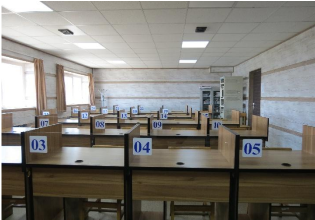
لابراتوار شماره ۱