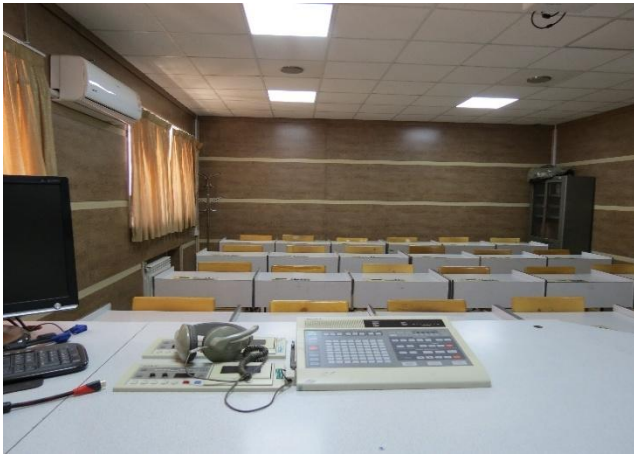
لابراتوار شماره ۳